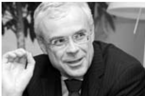
Владимир Шпидла Комисар по заетостта

дирекция в Европейската комисия със същото наименование. Компетенциите за изграждане на политиката остават на държавите членки, а ангажиментите са разписани в директиви, определящи цел и оставящи възможност за избор на държавите за методите за постигането ѝ. Инструменти също така са стратегиите и плановете за действие в тази област, като финансирането се осъществява от Европейския социален фонд и програми на общността.